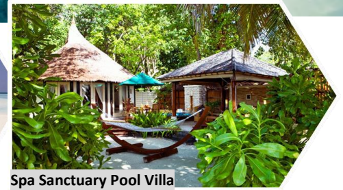
Spa Sanctuary Pool Villa