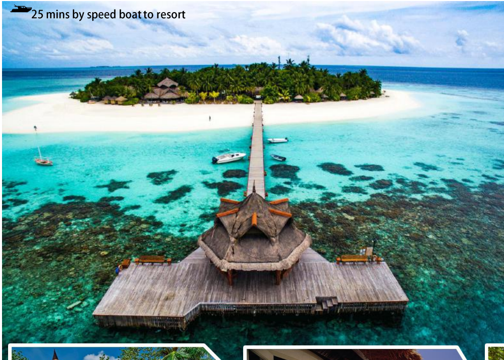
25 mins by speed boat to resort