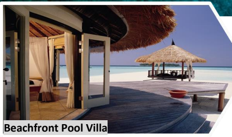
Beachfront Pool Villa