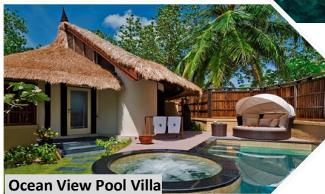
Ocean View Pool Villa